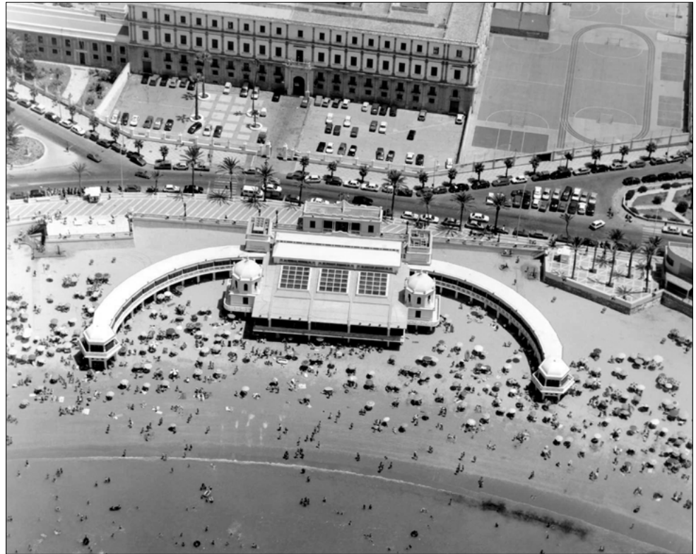
Vista aérea del Balneario de Nuestra Señora de la Palma y el Real (Cádiz). Sede del Centro de Arqueología Subacuática del Instituto Andaluz del Patrimonio Histórico