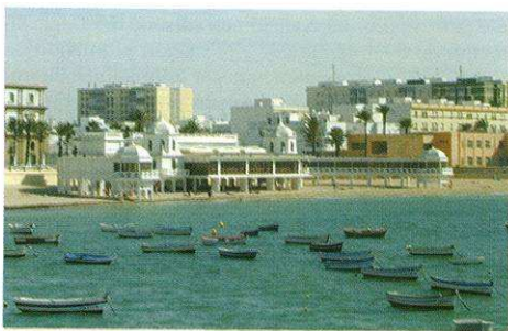
Fig. 1. El Balneario de Nuestra Señora de la Palma y el Real, sede del Centro de Arqueología Subacuática del Instituto Andaluz del Patrimonio Histórico (Foto Carlos Alonso).

En su desarrollo se han empleado diferentes canales de comunicación; unos, por medio de visitas guiadas (para grupos de escolares o turistas), jornadas de puertas abiertas, realización de actividades en colaboración con asociaciones culturales, conferencias, etc., encaminadas a atender a los visitantes que se interesaban por la labor del CAS y sus instalaciones, el histórico Balneario de Nuestra Señora de la Palma y el Real (fig. 1); otros, como publicaciones en la revista PH (Boletín del IAPH), conferencias, la web del IAPH, etc., para dar a conocer el CAS a las personas que no podían acceder al mismo.