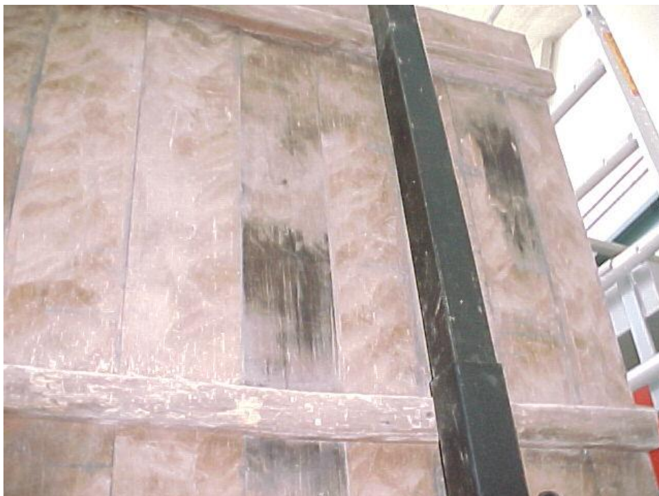
Fig. 6 – Reverso: zonas con pudrición parda.