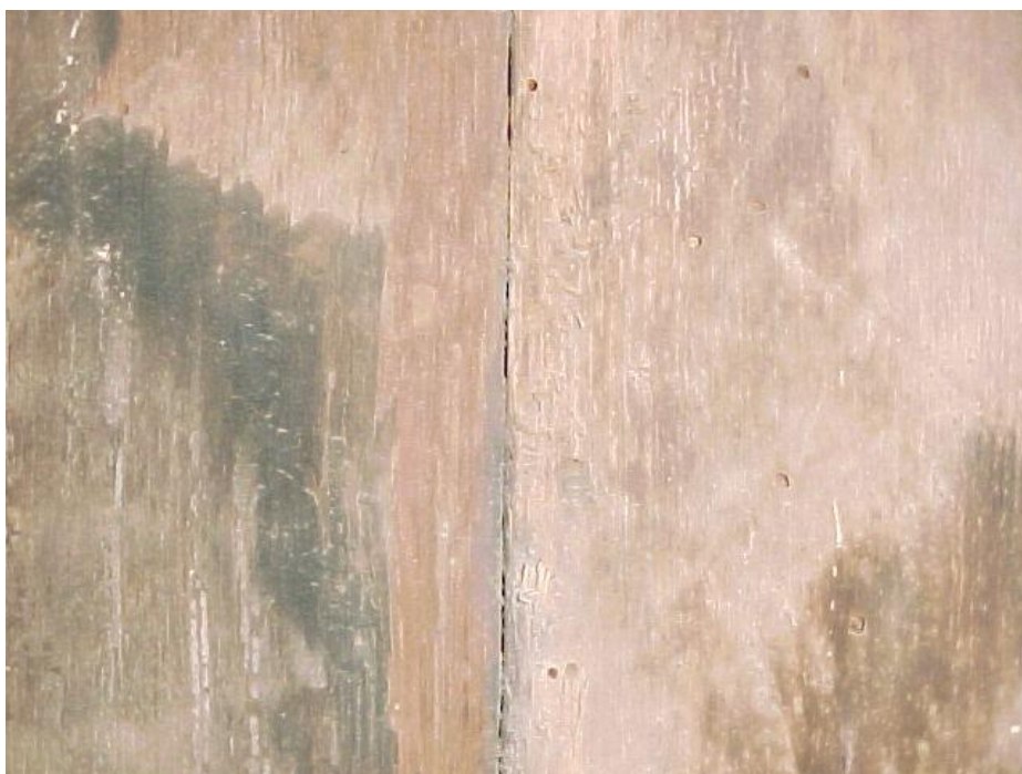
Fig. 3 – Reverso: pudrición parda y orificios de salida de insectos xilófagos, anóbidos.

Se observaron mediante una lupa de mano y se utilizó bibliografía especializada para su determinación.