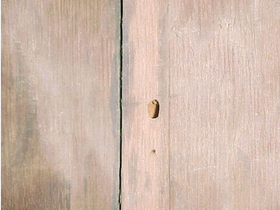
Fig. 5 – Reverso: orificios de salida de insectos xilófagos, cerambícidos.