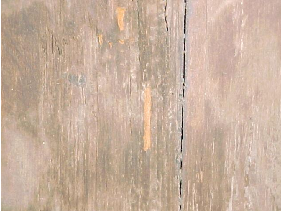
Fig. 4 – Reverso: galerías de insectos xilófagos, cerambícidos.