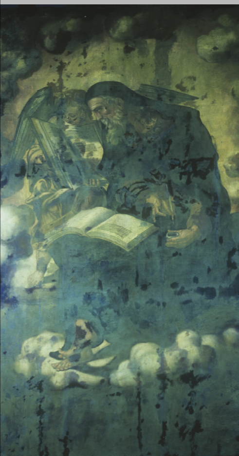
_ análisis con luz ultravioleta SAN MATEO