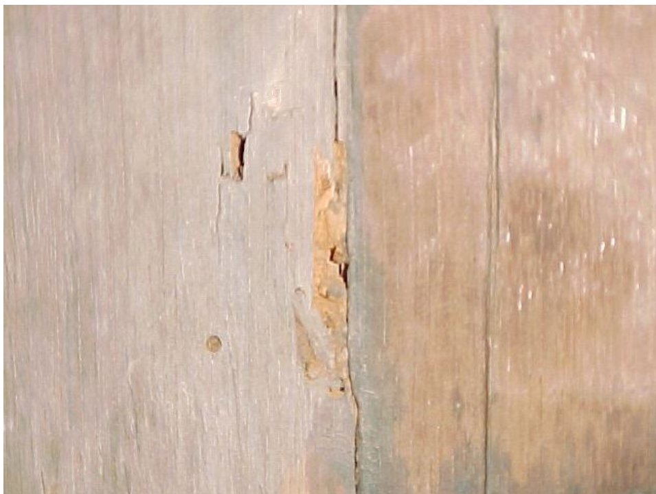
Fig. 3 – Galerías de insectos xilófagos (cerambícidos), reverso.