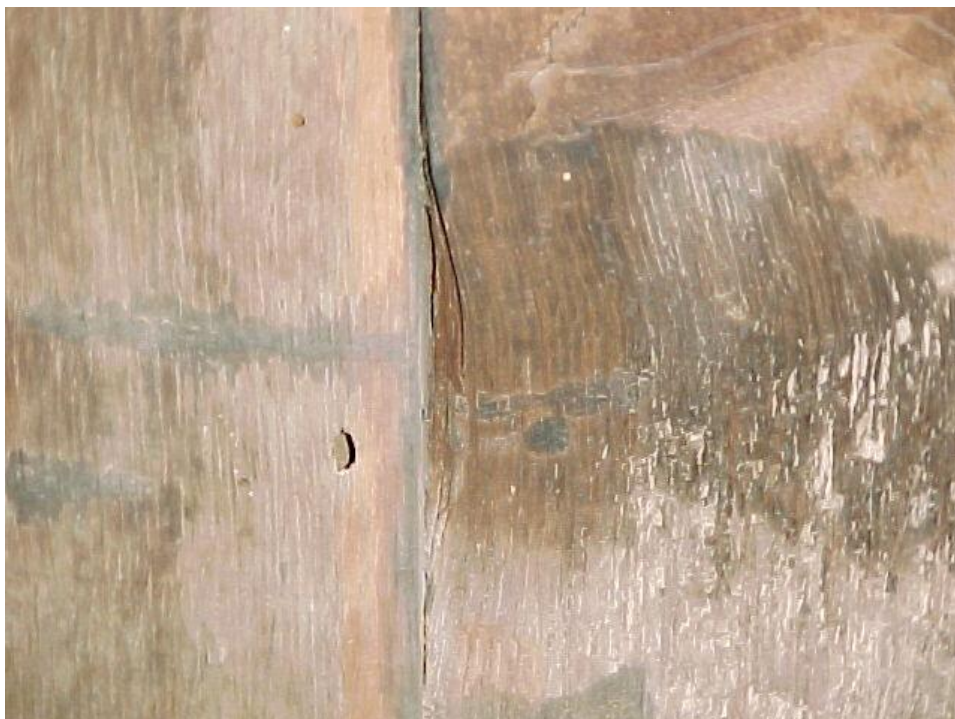
Fig. 4 – Orificio de salida de cerambícido y pudrición parda.