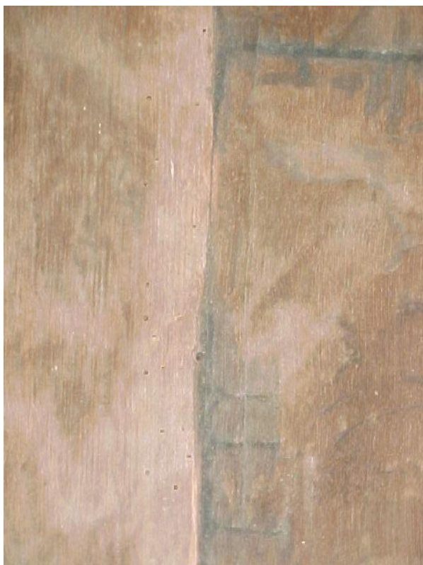
Fig. 2 – Orificios y galerías de insectos xilófagos (anóbidos), reverso.