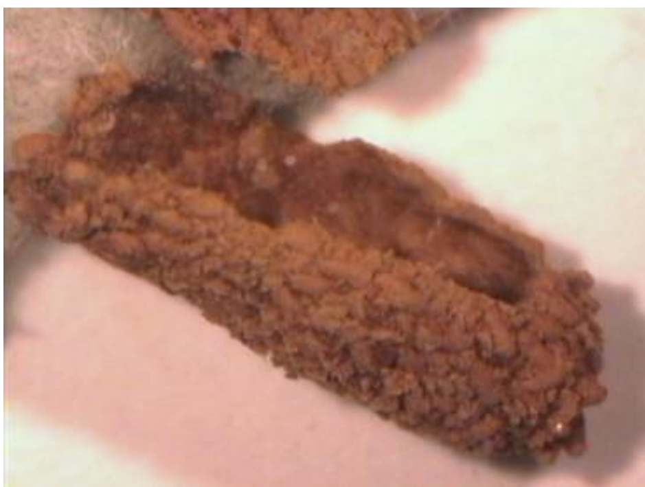
Fig. 5 – Pupas de anóbidos, 7X

No se puede asegurar que el tipo de coleóptero xilófago que está infestando la obra sea el anteriormente descrito, puesto que no se dispuso de ningún ejemplar para su estudio. Se trata sólo de una hipótesis basada en los restos de madera, en la forma y tamaño de los excrementos y en el tipo y tamaño de las galerías que se han observado durante la inspección.