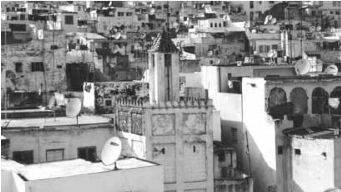
3. "Pero la ciudad no cuenta su pasado, lo contiene como las líneas de una mano, escrito en las esquinas de las calles, en las rejas de las ventanas, en los pasamanos de las escaleras, en las antenas de los pararrayos, en las astas de las banderas, cada segmento surcado a su vez por arañazos, muescas, incisiones, comas." Italo Calvino. Las ciudades invisibles . Marruecos. Gema Carrera Díaz

expresión de su identidad cultural y social; las normas y valores se transmiten oralmente... Sus formas comprenden, entre otras, la lengua, la literatura, la música, la danza, los juegos, la mitología, los ritos, las costumbres... (UNESCO, 1989).