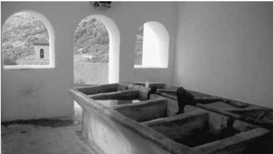
4. Patrimonio etnológico, Granada

En el Plan Estratégico de la Cultura en Andalucía (que no de cultura andaluza o de Andalucía) se asume el sacrificio que se hace convirtiendo la cultura en un producto, pero se habla sólo de compensar la mercantilización con productos de calidad. Al transformar