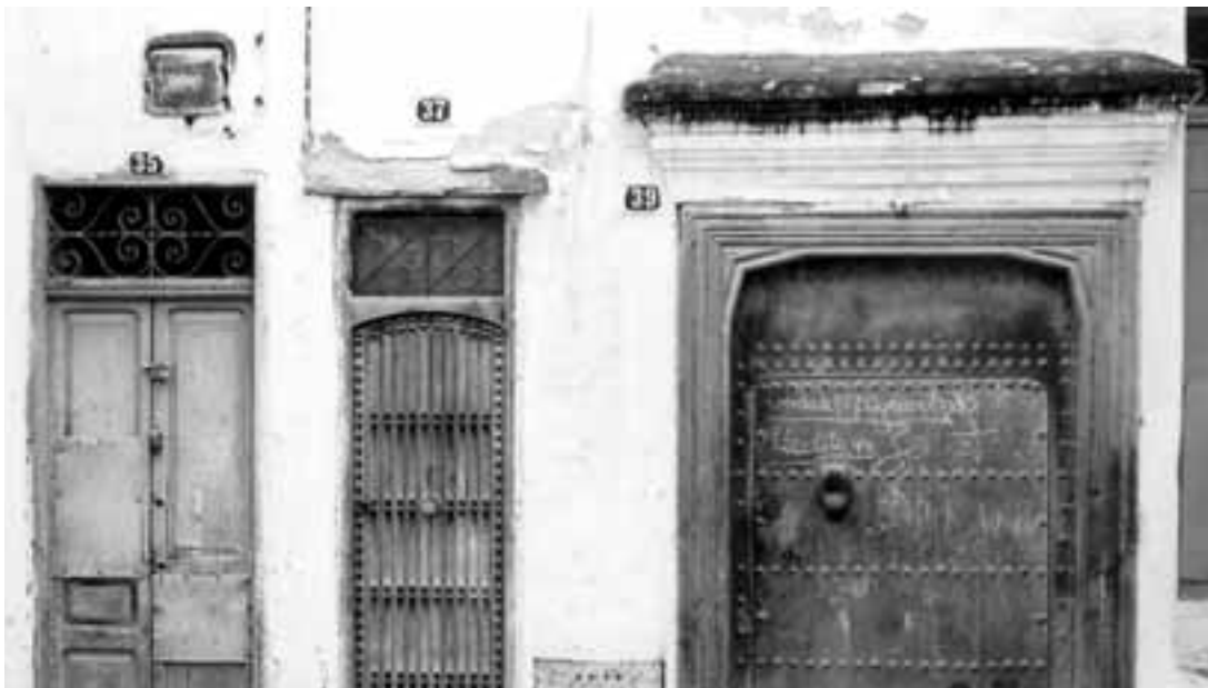
2. Puertas. Gema Carrera Díaz

concepto de patrimonio “inmaterial” reivindicado por la UNESCO.