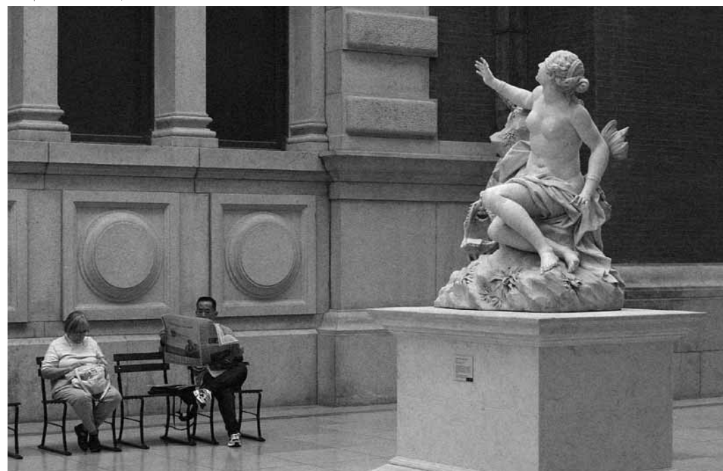
Metropolitan Museum of Art, New York. Dom Dada

De forma institucionalizada el Convenio Andrés Bello ha ido también considerando la importancia y pertinencia de generar pensamiento entre patrimonio y medios de información. Ya en 1999, cuando el Convenio convocó a la Primera Reunión Internacional de Expertos en Patrimonio Cultural y Natural se alcanzaron conclusiones y recomendaciones específicas sobre el tema: “educación y comunicación son temas centrales en una estrategia de defensa, conservación y puesta en valor del patrimonio, puesto que sólo una política en este sentido puede gestar una conciencia patrimonial en las comunidades”. Sin embargo, no será hasta 2002, junto al Ministerio de Cultura de Colombia, y en el marco de la Campaña de Sensibilización al Pueblo Colombiano sobre la Riqueza de su Patrimonio Oral e Inmaterial, cuando se logre un grado de compromiso mayor aprovechando la celebración del Seminario Internacional sobre Medios de Comunicación y Patrimonio Inmaterial 16 . En este encuentro se reconoce que el poder de los medios de comunicación, en general y frente al patrimonio inmaterial, no se halla efectivamente en su labor de transmisión de la información sino en su capacidad, dedicación y legitimidad para configurar los hechos, las realidades, las visiones... 17