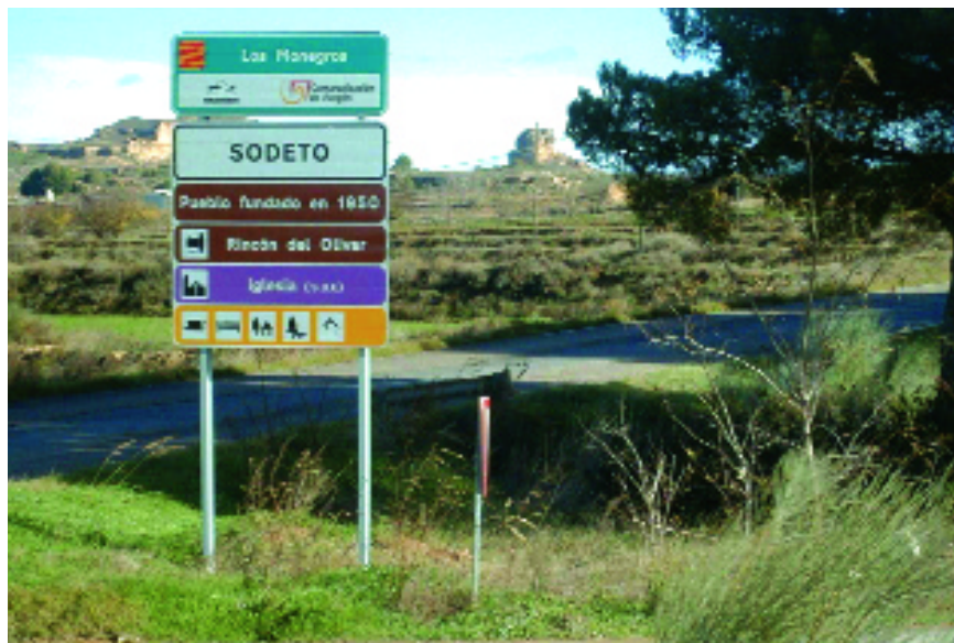
Señalización informativa a la entrada de Sodeto.

Ésta se inicia propiamente en la primera sala, dedicada a mostrar la génesis y el contexto histórico, las principales dimensiones de la colonización (las transformaciones territoriales, agronómicas, urbanísticas y sociales), sus magnitudes y la geografía de la misma, considerando todo el territorio nacional. La segunda sala está dedicada a las realizaciones del valle del Ebro y en las tres provincias de Aragón: Huesca, Zaragoza y Teruel. Para cada una de ellas se presentan las zonas regables más significativas: su origen, planificación, ejecución y realizaciones más importantes. Todo ello ilustrado con abundante repertorio fotográfico y cartográfico. Al final de esta misma sala, una consola con auriculares permite acceder a testimonios sonoros de algunos testigos y protagonistas de esta política, sobre todo colonos y familiares y algunos funcionarios que intervinieron en la transformación de las zonas. La tercera sala está dedicada a mostrar con más detalle las tres dimensiones principales de la colonización: la transformación agronómica, social y urbanística, ilustrando el proceso de transformación y sus características. La cuarta y última sala está dedicada a mostrar aspectos de la vida cotidiana y es la que tiene un mayor carácter museístico y etnográfico.