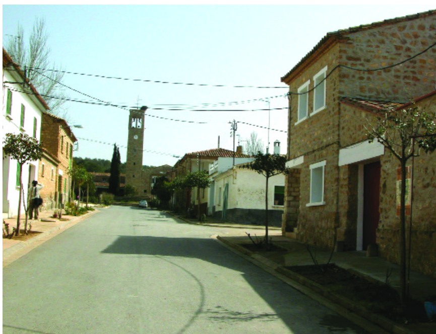
Calle de Sodeto donde se encuentra el CICA (derecha).

que el lector podrá conocer en las páginas de esta revista), significó una profunda transformación del paisaje rural de las zonas intervenidas. Zonas esteparias (como en Aragón), zonas de monte bajo o de dehesas (como en el caso de Extremadura), zonas húmedas, de marismas (como en el bajo Guadalquivir), de deltas (como el delta del río Ebro), de lagunas (como en Antela, Lugo), entre otras, fueron transformadas en zonas de regables. Ello supuso la creación de una amplia y compleja infraestructura hidráulica (pantanos, grandes canales, red principal y secundaria de canales y acequias, otras obras hidráulicas -sifones, aliviaderos, canales de desagüe-, una nueva red de caminos de servicio, repoblaciones, movimientos de tierras para nivelaciones y parcelaciones, transformación del mapa parcelario, de la estructura de la propiedad fundaria, nuevos poblados, nuevas barriadas anejas a los viejos pueblos, instalaciones agrícolas complementarias). Tras estas transformaciones, el cambio paisajístico se completa con la introducción de nuevos cultivos que vinieron a sustituir a los cultivos y aprove-