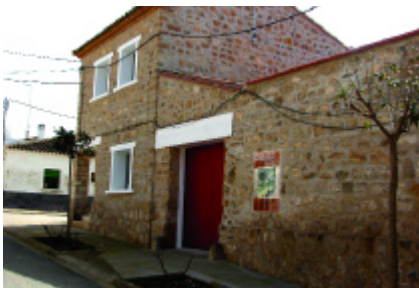
Centro de Interpretación de la Colonización Agraria en España y en Aragón.

chamientos tradicionales. El viajero que discorra por alguna de estas zonas no puede hacerse una idea de lo que eran antes de la transformación. Por eso, el primer objetivo es mostrar al visitante la génesis de un nuevo espacio rural y los contenidos de las diferentes dimensiones de la obra colonizadora: la transformación agronómica, la transformación social y la urbanística, mostrando el antes y el después de los cambios.