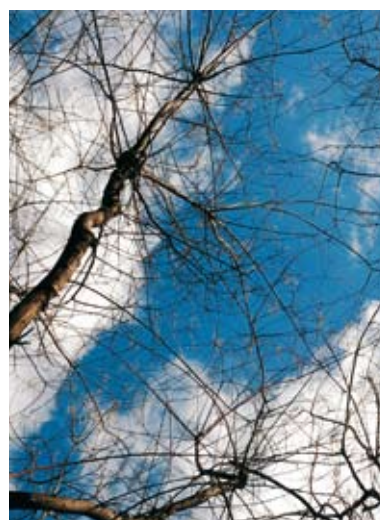
AGENDA Y PUBLICACIONES_ 130