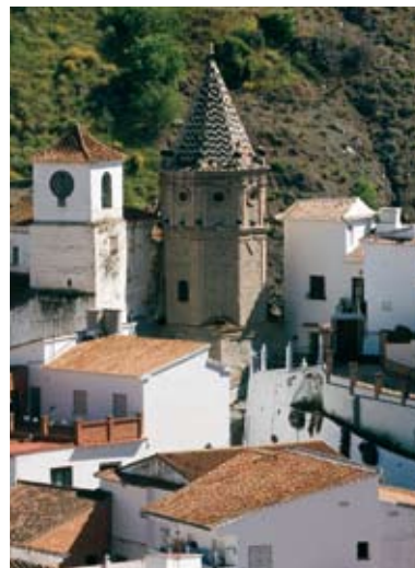
BIENES, PAISAJES E ITINERARIOS_ 042