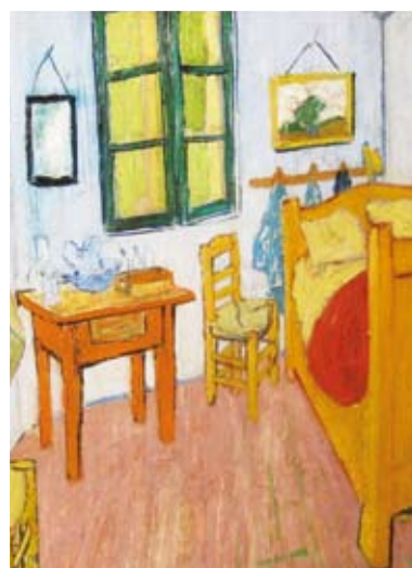
AGENDA Y PUBLICACIONES_ 126