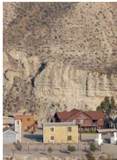
BIENES, PAISAJES E ITINERARIOS_ 042