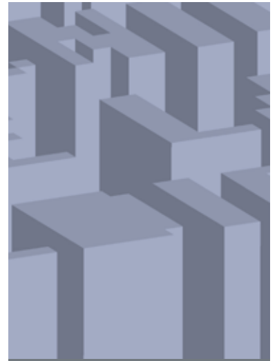
AGENDA Y PUBLICACIONES_ 130