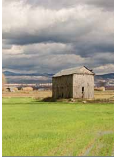
BIENES, PAISAJES E ITINERARIOS_ 018