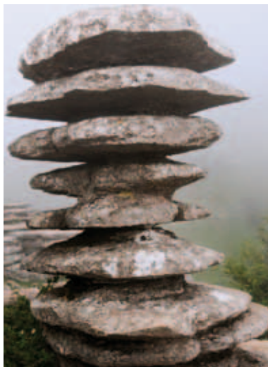
BIENES, PAISAJES E ITINERARIOS_ 020