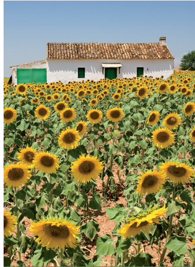
BIENES, PAISAJES E ITINERARIOS_ 020