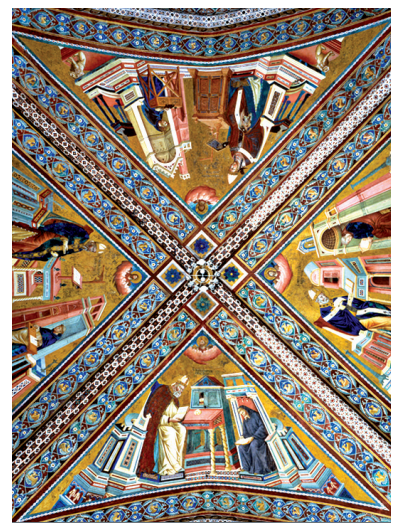
AGENDA Y PUBLICACIONES_ 126