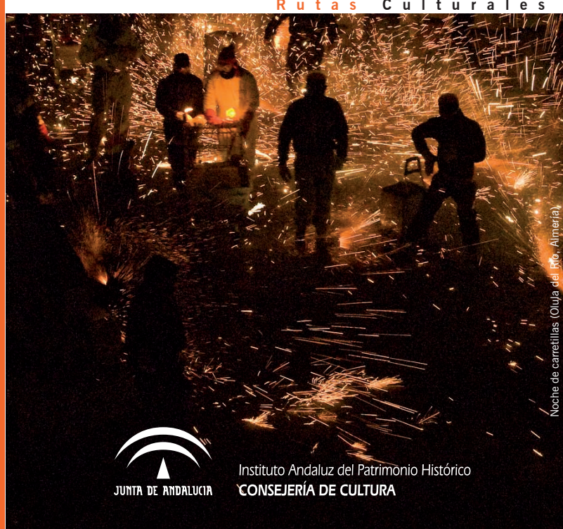
Noche de carretillas (Olula del Río, Almería)