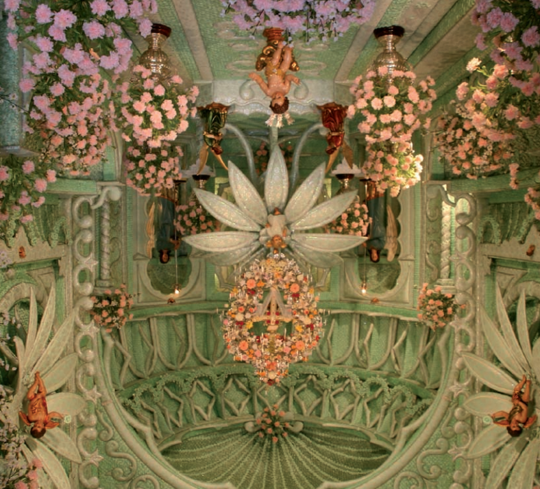
Almonaster la Real > Alosno > Bonares