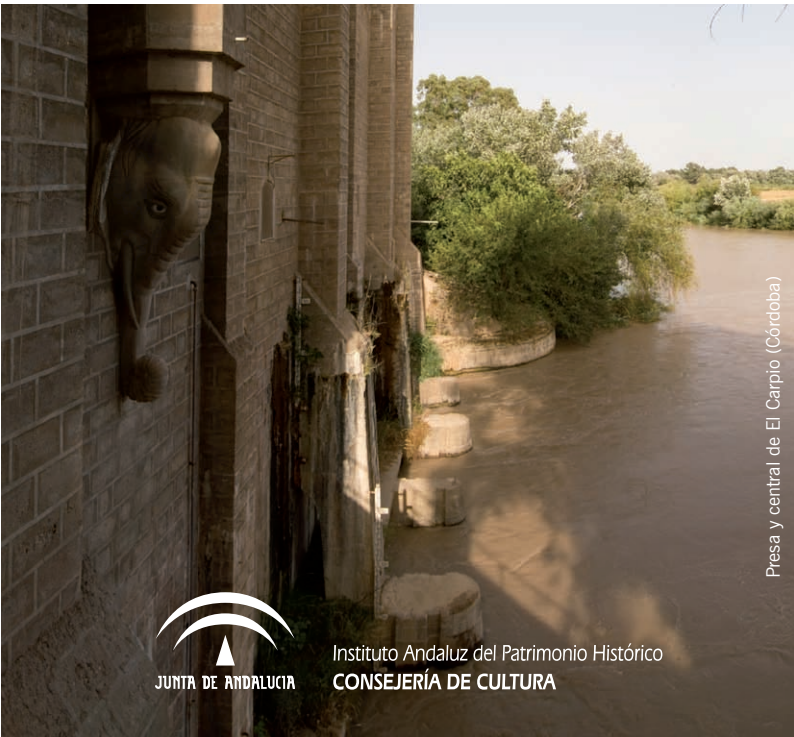
Presas y central de El Carpio (Córdoba)