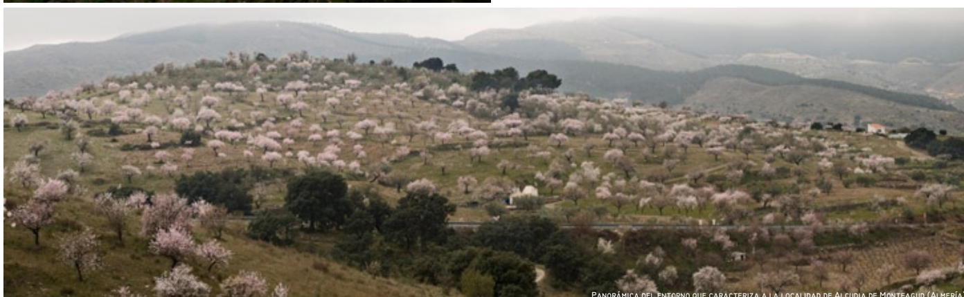
PANORÁMICA DEL ENTORNO QUE CARACTERIZA A LA LOCALIDAD DE ALCUDIA DE MONTEAGUD (ALMERÍA)

En las últimas dos décadas la extensión hacia levante del cultivo bajo plástico está suponiendo un nuevo impulso a la actividad agrícola de la franja litoral aunque el precio medioambiental y paisajístico está resultando muy elevado.