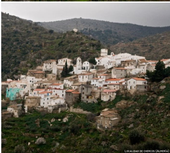
LOCALIDAD DE CERCOS (ALMERÍA)

Frente a la aridez de otras zonas de Almería, entre los ríos Antas y Almanzora surge una fértil vega que origina un magnífico paisaje de huertas y casas de labor. La feracidad de estas tierras, a pesar de que el caudal de agua de estos ríos es irregular, ha propiciado su tradicional orientación agrícola. Teniendo como base el legado hidráulico romano, es durante el periodo andalusí, cuando el manejo del agua, su mundo simbólico y su uso impregnan el territorio.