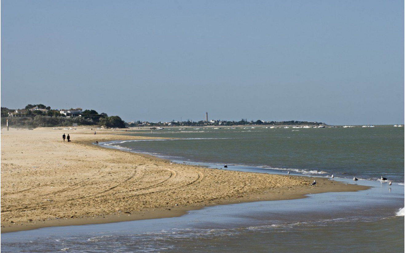
En Sanlúcar de Barraeda, la playa de Bajo Guía está cercana al curso del río en Bonanza y acoge gran parte de la actividad urbana. En la lejanía, las playas de La Jara se han poblado de residencias estivales y conservan en la costa los corrales para el marisqueo más próximos a la vecina localidad de Chipiona.

Ámbito/s: 14 Marisma; 13 Bahía de Cádiz; 12 Dunas y arenales costeros de Doñana; 15 Campiñas de Jerez-Arcos.