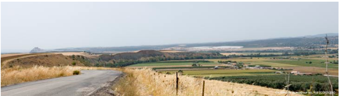
ENTORNO DE ALMODÓVAR DEL RÍO (CÓRDOBA)

A modo de espolón o avanzadilla de la sierra sobre el río, el castillo de Almodóvar es connotado como imagen “viajera” que singulariza visualmente el trayecto entre Córdoba y Sevilla. Su posición dominante y la proximidad inmediata al río Guadalquivir y, por tanto, a las distintas líneas de la red de comunicaciones tradicionales en uso hasta la actualidad, le aportan además un sentido de control, poder político y fuerza que lo conectan con el ideal paisajístico medieval de la población-castillo y su área de influencia sobre los recursos de un rica vega agrícola y zona de paso estratégico en el valle.