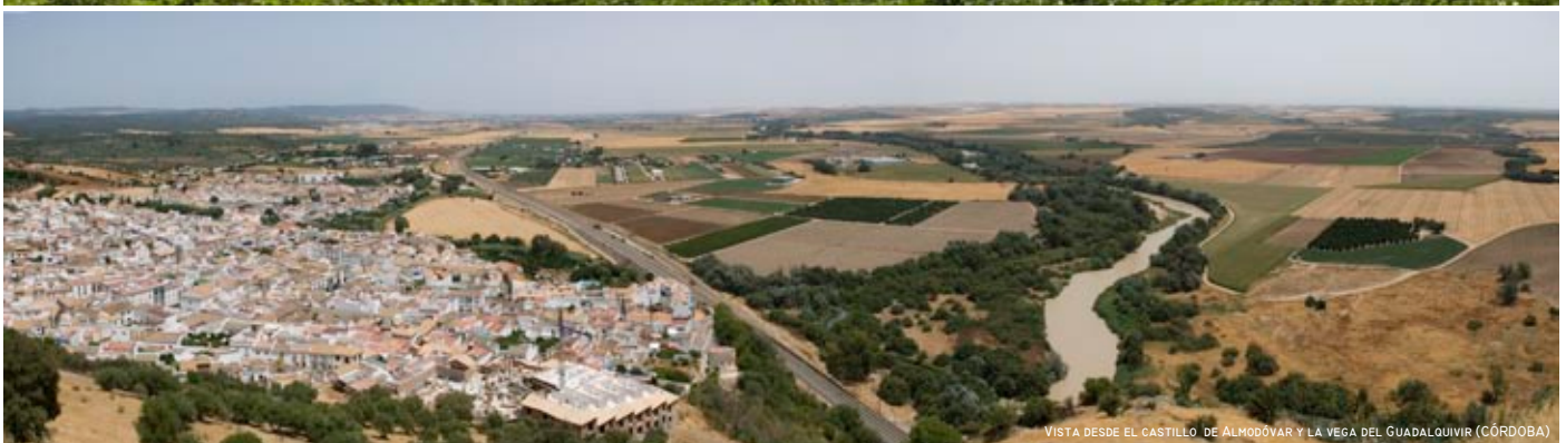
VISTA DESDE EL CASTILLO DE ALMODÓVAR Y LA VEGA DEL GUADALQUIVIR (CÓRDOBA)