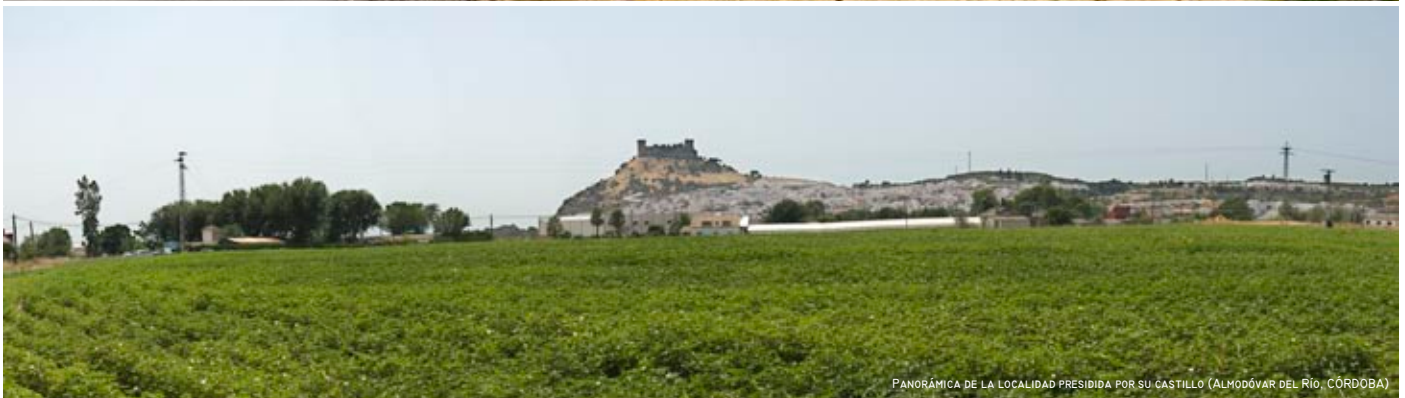
PANORÁMICA DE LA LOCALIDAD PRESIDIDA POR SU CASTILLO (ALMODÓVAR DEL RÍO, CÓRDOBA)