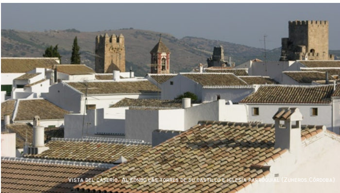
VISTA DEL CASERÍO. AL FONDO LAS TORRES DE SU CASTILLO E IGLESIA PARRROQUIAL (ZUHEROS, CÓRDOBA)