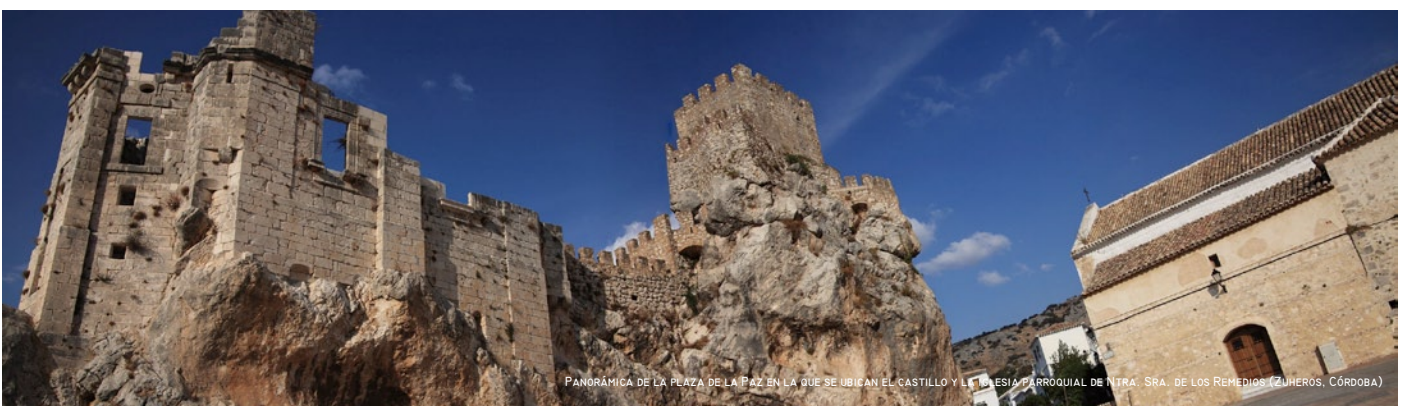
PANORÁMICA DE LA PLAZA DE LA PAZ EN LA QUE SE UBICAN EL CASTILLO Y LA IGLESIA PARRROQUIAL DE NTRA. SRA. DE LOS REMEDIOS (ZUHEROS, CÓRDOBA)