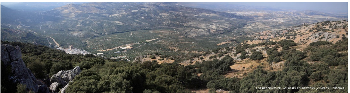
ESTRIBACIONES DE LAS SIERRAS SUBBÉTICAS (ZUHEROS, CÓRDOBA)