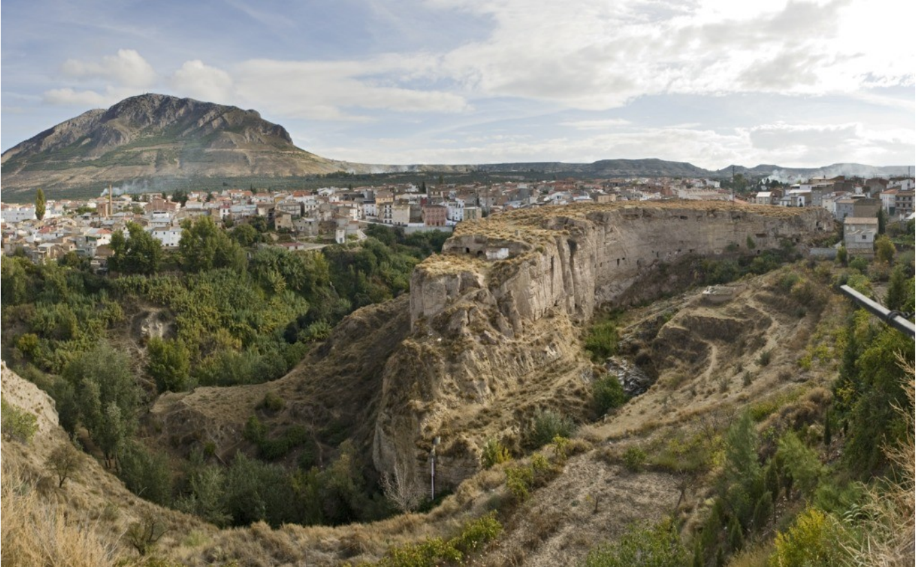
El cerro Jabalcón preside las visuales que se tienden desde occidente sobre el cañón formado por del río y la gran llanura donde se encuentra la localidad de Zújar.