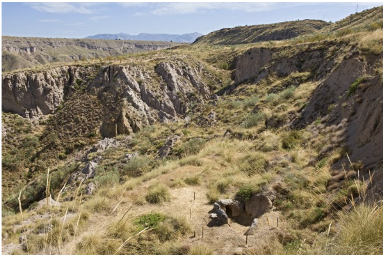
Formaciones naturales en el barranco y dólmenes en el valle del río Gor.

Área/s: E1. Altiplanos esteparios. Ámbito/s: 44. Depresión de Guadix.