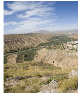
Dólmenes, vistas del altiplano sobre el cañón del río Gor y emplazamiento de la localidad de Gorafe.