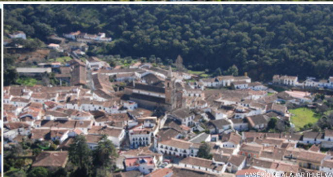
CASERÍO DE ALÁJAR (HUELVA)