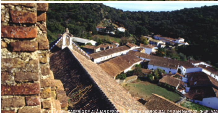
VISTA DEL CASERÍO DE ALÁJAR DESDE LA IGLESIA PARROQUIAL DE SAN MARCOS (HUELVA)