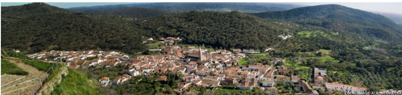
LOCALIDAD DE ALÁJAR (HUELVA)