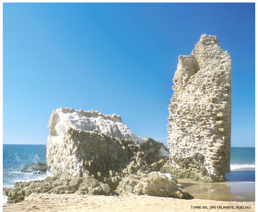
TORRE DEL ORO (ALMONTE, HUELVA)