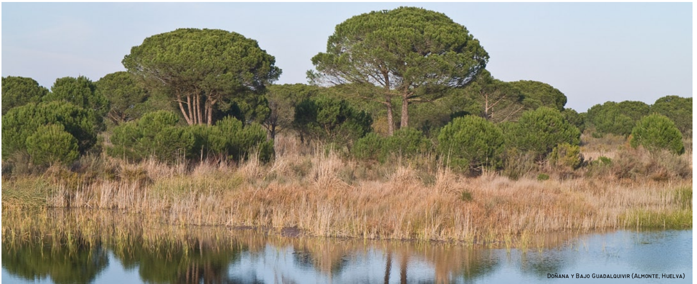
DOÑANA Y BAJO GUADALQUIVIR (ALMONTE, HUELVA)

La playa de Castilla es la más extensa de Andalucía, a lo largo de la costa dispone una serie de torres vigía que permitan la comunicación visual, rápida y eficaz respecto a posibles ataques o incursiones marítimas. En la actualidad, los vestigios de las torres (muy mermadas respecto a su condición original) se encuentran en el borde del parque de Doñana y en uno de los parajes más abiertos y singulares del territorio andaluz.