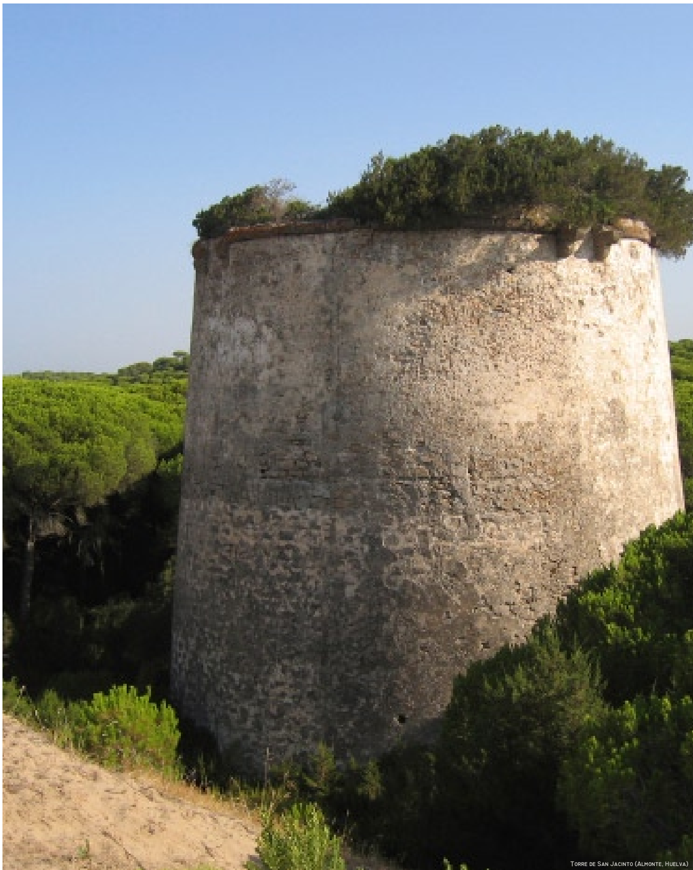
TORRE DE SAN JACINTO (ALMONTE, HUELVA)

ÁMBITO/S: DUNAS Y ARENALES COSTEROS DE DOÑANA