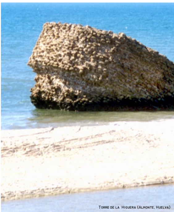
TORRE DE LA HIGUERA (ALMONTE, HUELVA)