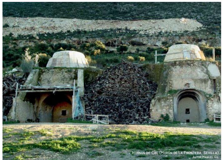
HORNOS DE CAL (MORÓN DE LA FRONTERA, SEVILLA) AUTOR: MANUEL GIL