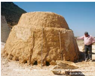
PREPARACIÓN HORNO DE CAL (MORÓN DE LA FRONTERA, SEVILLA) AUTOR: MANUEL GIL

Frentes y paredes cortadas mostrando un intenso color blanco como producto de la extracción de piedra caliza, se conjugan con la imagen de las edificaciones de los hornos. Su autenticidad y su pervivencia como actividad y los cromatismos de la cal aportan carácter al paisaje de Morón en la campiña serrana de Sevilla.