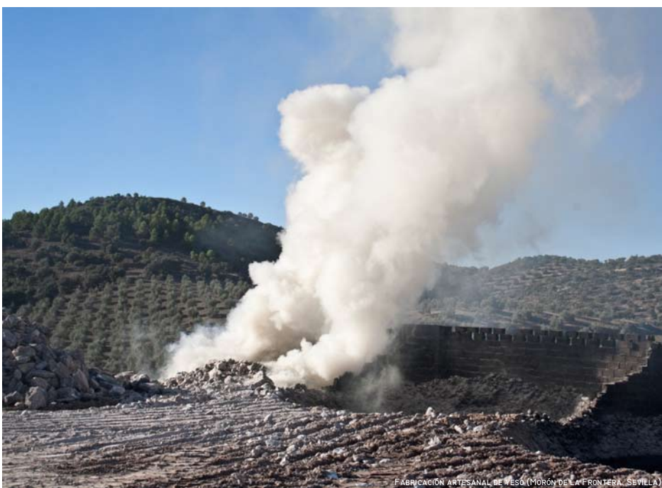
FABRICACIÓN ARTESANAL DE YESO (MORÓN DE LA FRONTERA, SEVILLA)