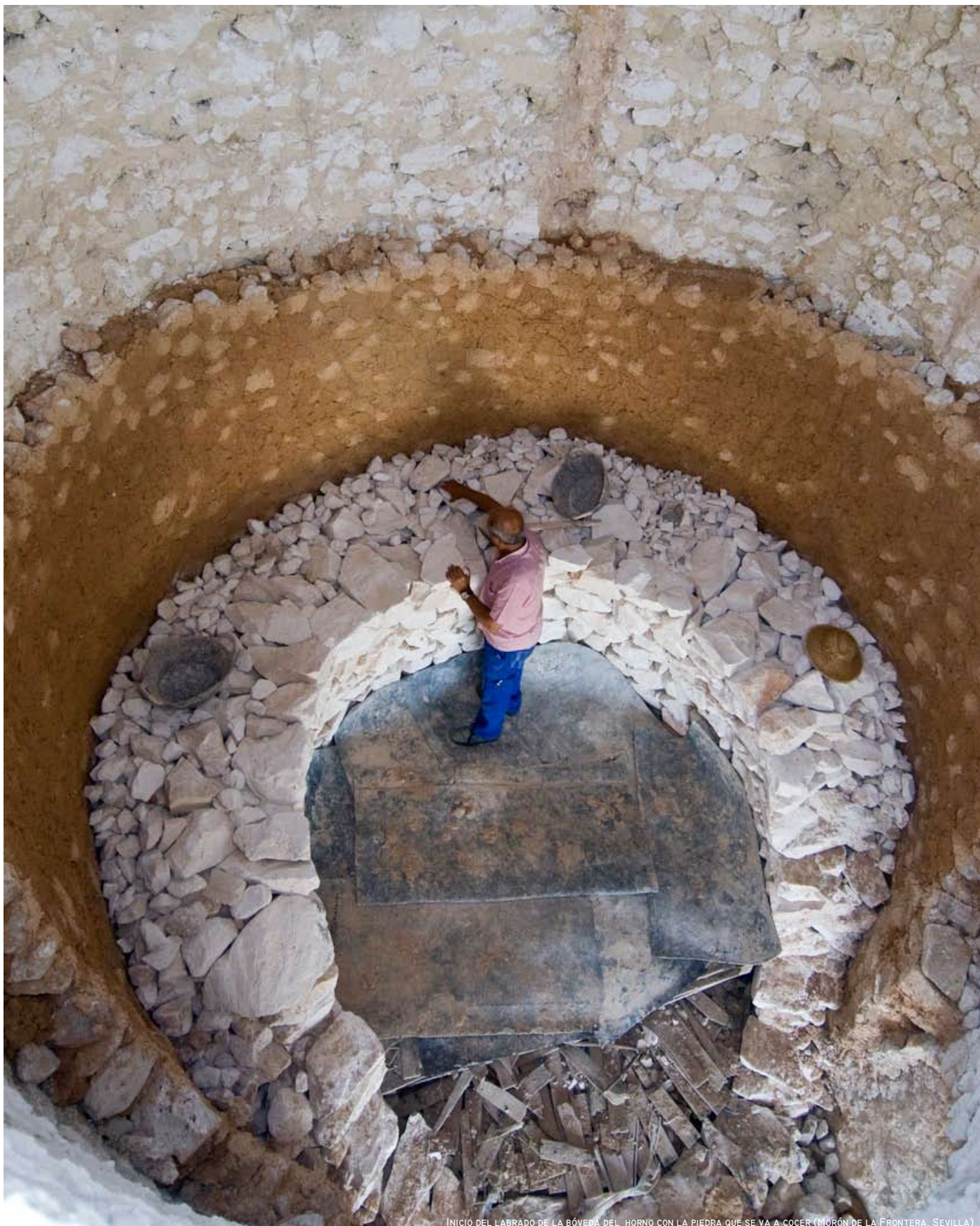
INICIO DEL LABRADO DE LA BÓVEDA DEL HORNO CON LA PIEDRA QUE SE VA A COCER (MORÓN DE LA FRONTERA, SEVILLA)

ÁMBITO/S: CAMPIÑAS DE SEVILLA-PIEDEMONTE SUBBÉTICO