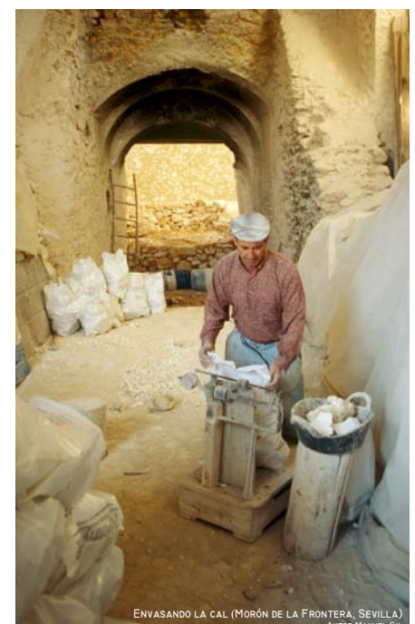
ENVASANDO LA CAL (MORÓN DE LA FRONTERA, SEVILLA) AUTOR: MANUEL GIL