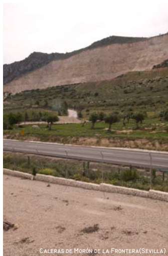
CALERAS DE MORÓN DE LA FRONTERA (SEVILLA)