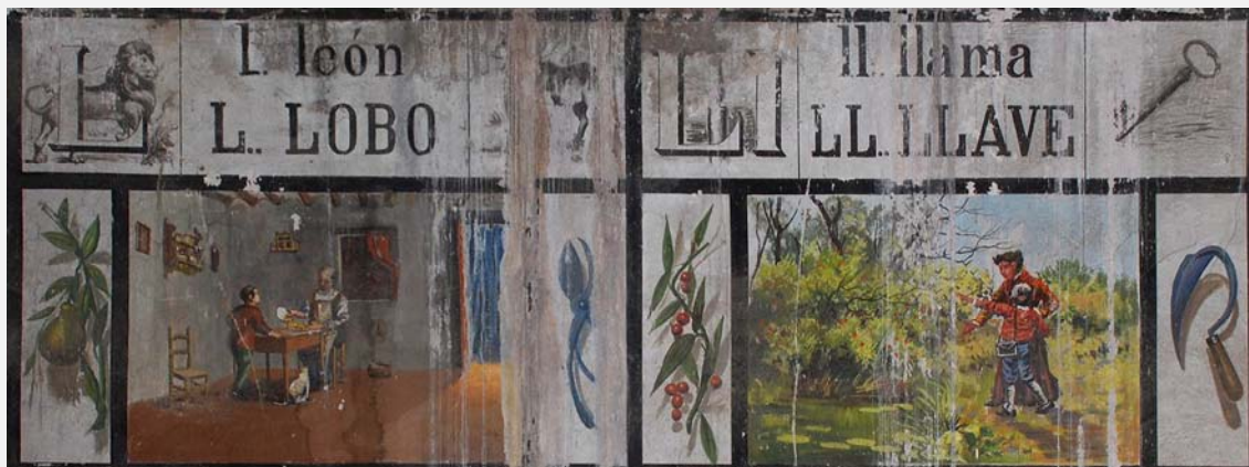
Detalle del friso abecedario (PH81, febrero 2012, p. 50).