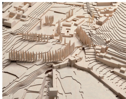
Maqueta general de la propuesta del atrio desde el recinto amurallado de la Alhambra. Escala 1/500

plataforma del agua, supone una mejora ambiental y paisajística considerable. (...) El atrio se concibe como un espacio de acogida, ajardinado y abierto al público. La suave pendiente desde la rotonda de