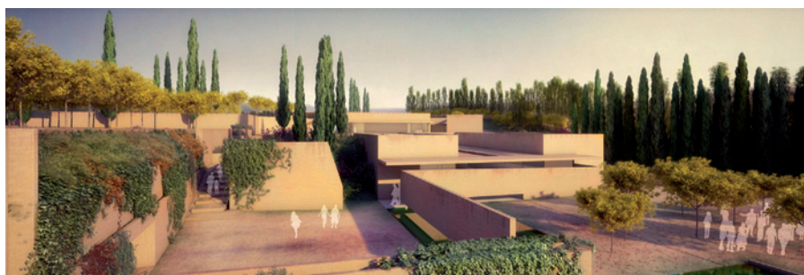
Imagen exterior de la plaza de la Alhambra y acceso al conjunto monumental.

El Plan Director de la Alhambra 2007-2015 establecía la necesidad de una mejora de la visita pública al monumento, que se tradujo en proyectar la reforma del área de recepción de visitantes. Con este objetivo se convocó en 2010 el concurso arquitectónico internacional denominado Atrio de la Alhambra. El fallo del concurso se hacía público el pasado mes de febrero. El proyecto Puerta Nueva, seleccionado entre 41 propuestas de grupos de arquitectos de diez nacionalidades diferentes, supondrá la creación de una plataforma ajardinada sobre un gran vestíbulo, que permitirá recuperar las vistas sobre murallas y torres.