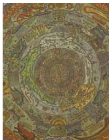
Bibliografía y reseñas_ 157