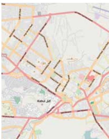
La difusión del patrimonio: los servicios de mapas_ 132