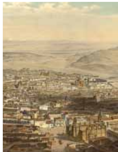
La cartografía como fuente de información para la investigación patrimonial_ 054