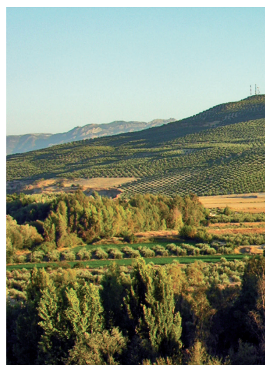
AGENDA Y PUBLICACIONES_ 116