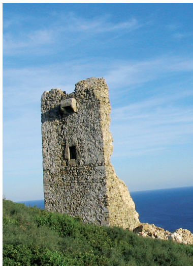
BIENES, PAISAJES E ITINERARIOS_ 014