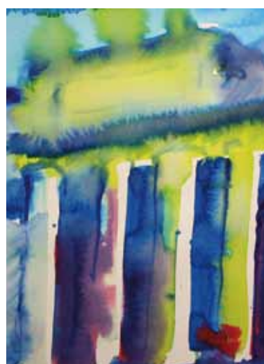
AGENDA Y PUBLICACIONES_ 092