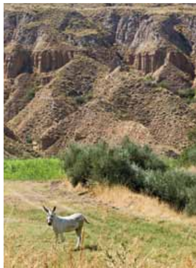
BIENES, PAISAJES E ITINERARIOS_ 012