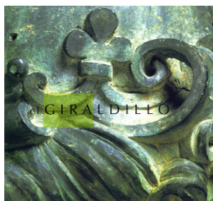
Catálogo de la muestra

El pasado 6 de enero se clausuró la muestra El Giraldillo. Proceso de una restauración, tras la decisión por parte de la Consejería de Cultura de prorrogar su apertura a causa del éxito de visitas registrado, que alcanzó 77.575 personas.