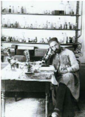
Autorretrato de Cajal en su laboratorio de Valencia, h.1885. Copia digital de placa al gelatino-bromuro, 9'9 x 6'3 cm. Imagen procedente del catálogo Santiago Ramón y Cajal (1852-2003). Ciencia y Arte. Madrid: La Casa Encendida, 2003, p. 75 (CAT 005)