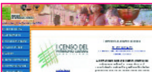
Web del Instituto de Patrimonio Cultural de Venezuela: www.ipc.gov.ve

Sobre este fundamento se consideró la necesidad de elaborar un Taller SIRCHAL (Seminario Interna-