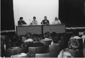
Mesa redonda durante el Festival en pasadas ediciones