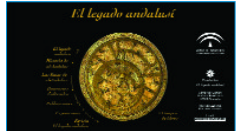
Pantalla de la web de la Fundación Legado Andaluzí

A partir de ahora, el Legado Andaluzí, único itinerario transfronterizo europeo, y el Camino de Santiago serán las dos rutas españolas que gozarán de esta consideración.