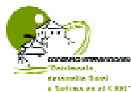
Logo del foro internacional