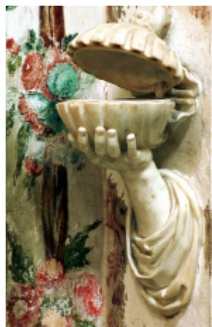
Pila de agua bendita