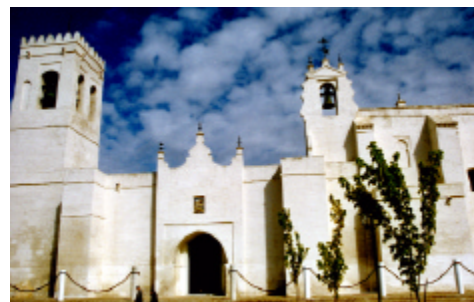
Iglesia Parroquial de San Bartolomé. Villalba del Alcor, Huelva