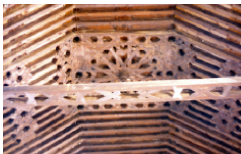
Convento de la Trinidad. Málaga