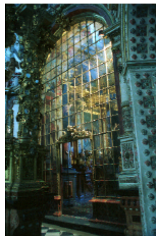
3. Sagrario. Cancel de cristal