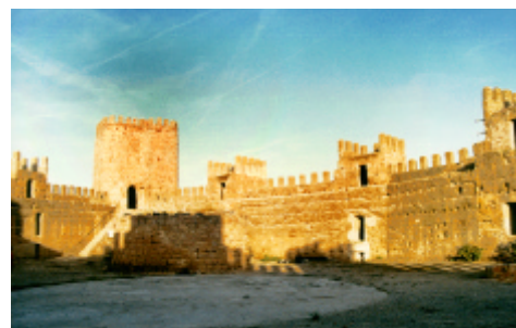
Castillo. Baños de la Encina, Jaén