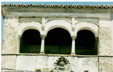
Palacio del Mayorazgo. Arcos de la Frontera, Cádiz