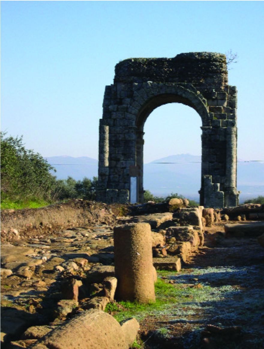
La Vía de la Plata en Cáparra. Cáceres

cia su salida hacia tierras castellano-leonesas. A su paso conserva numerosos restos arqueológicos: miliarios que señalizaban el camino, puentes para salvar los ríos, mansio o lugares que servían de descanso al viajero, etc.