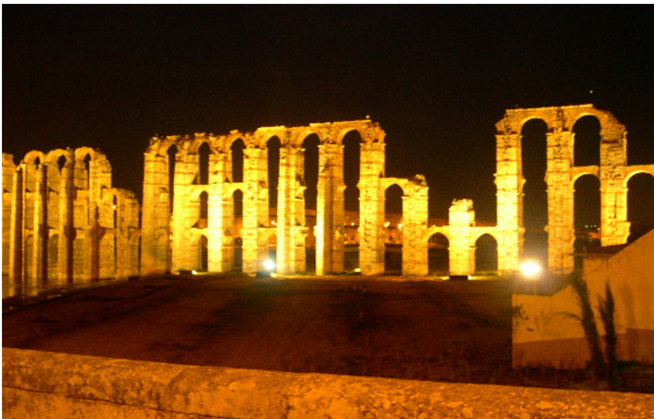
Acueducto romano de Los Milagros. Mérida

El proyecto ha supuesto la recuperación de un camino milenario de algo más de 300 Km que geográficamente atraviesa axialmente Extremadura, conformando un corredor que iría desde la localidad de Monesterio, en el límite sur de la Comunidad Autónoma Extremeña, hasta Baños de Montemayor, en el norte de la provincia de Cáceres, donde ini-