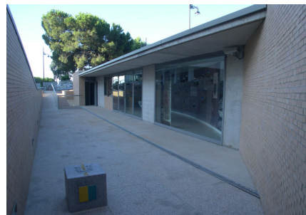
Vista exterior del Centro de Interpretación General de la Vía de la Plata. Zona arqueológica de Morería. Mérida

La ayuda económica para poder llevar a cabo las intervenciones definidas en el proyecto, 19.666.318,08 euros, se realiza a través de una subvención con cargo al Mecanismo Financiero del Espacio Europeo de Inversiones (EFTA), mediante un convenio firmado entre el Banco Europeo de Inversiones (BEI) y la Comunidad Autónoma de Extremadura (Junta de Extremadura).