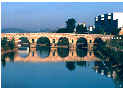
Puente romano de la Vía de la Plata sobre el río Guadiana. Mérida

La ejecución del propio proyecto ha supuesto una dinámica de empleo durante la implantación y desarrollo del mismo (1998-