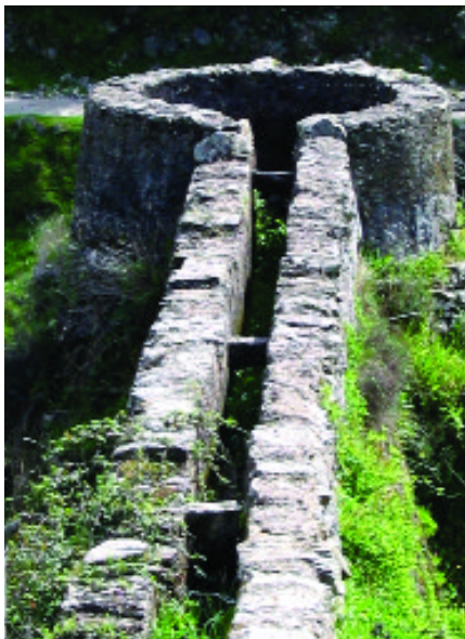
Molino de Rodezno. Arroyomolinos de León (Huelva)

Antropólogo. Delegación Provincial de Cultura de Huelva