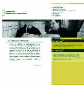
Web del Congreso organizado por ASANA