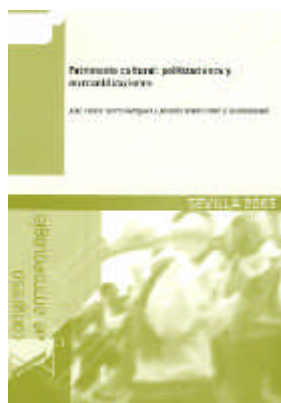
Portada de una de las actas publicadas

Gema Carrera Díaz Antropóloga Centro de Documentación del IAPH