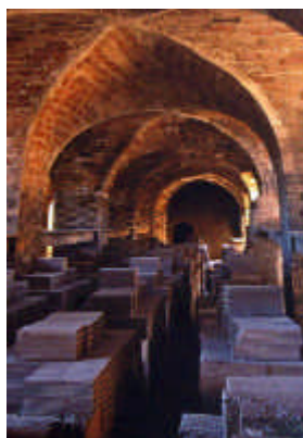
Obra premiada en el Certamen de Fotografía

La asociación INCUNA Máximo Fuertes Acevedo organizó por séptimo año consecutivo las Jornadas Internacionales de Patrimonio Industrial , desarrolladas en Gijón del 21 al 24 del pasado septiembre. El tema central de las jornadas giró en torno a "Las huellas de Atenea: el patrimonio industrial de la guerra en tiempos de paz". Se presentaron medio centenar de comunicaciones, de ámbito tanto nacional como internacional, relacionadas con el estudio, el análisis, la interpretación y la puesta en valor del amplio patrimonio histórico e industrial relacionado con la guerra y con la política de defensa de los países, con especial atención a España desde finales del siglo XVIII.