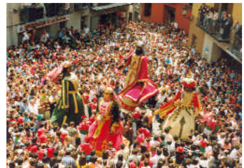
Gigantes durante La Patum de Berga.

Esta tercera proclamación reviste una importancia particular, porque probablemente será la última en su género. La Conferencia General de la UNESCO adoptó en 2003 la Convención para la salvaguardia del patrimonio cultural inmaterial, en la que se prevé la creación de una Lista representativa del patrimonio cultural inmaterial de la humanidad y otra Lista del patrimonio cultural inmaterial que requiere medidas urgentes de protección. Para asegurar la continuidad de la salvaguardia de las obras maestras proclamadas por la UNESCO desde 2001, la Convención ha previsto que todas las que pertenecen a los Estados Parte en la Convención se inscriban en la Lista representativa del patrimonio cultural inmaterial de la humanidad.