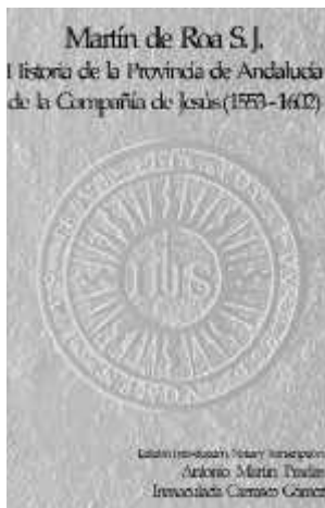
Portada de la publicación

El pasado 9 de octubre tuvo lugar la presentación, en el Palacio de Benamejil de Écija (Sevilla), de la Historia de la Provincia de Andalucía de la Compañía de Jesús , del Padre Martín de Roa Francés S.J. Con la colaboración del ayuntamiento ecijano y la asociación cultural Amigos de Écija, se ha publicado la transcripción del manuscrito original que el jesuita cordobés dejó escrito en 1602 sobre las fundaciones de Colegios de la Compañía en Andalucía.