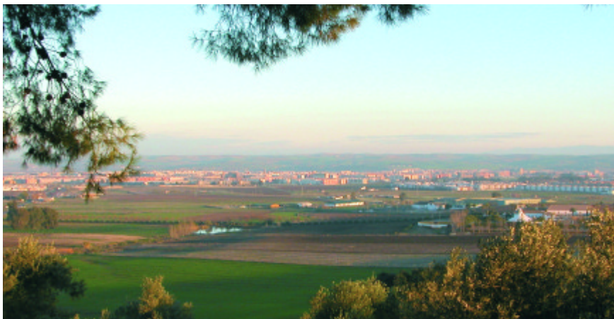
Panorámica de Córdoba

el inmueble por las dos comunidades que lo usaron como templo, y que aún perviven hoy en el espacio. Se analizaron las causas que podrían explicar la elección de la ubicación de la Mezquita primero sobre un templo cristiano de época hispano-visigoda, y siglos después, la construcción de la Iglesia Catedral en el corazón de la Mezquita Aljama. Por último, se expusieron otros modelos de implantación y uso, con otros ejemplos que conocemos en Andalucía (Niebla, Almonaster, Sevilla, Fiñana, etc.)