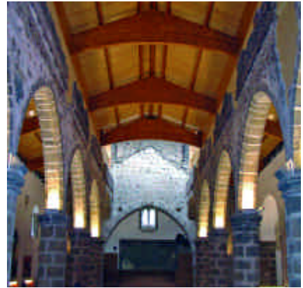
Ermita de Santa María de la Encina. Burguillos del Cerro (Badajoz) / PROYECTO VÍA DE LA PLATA