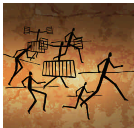
El equipo de investigación de Atapuerca recibió el premio en 2002

Más información en la web www.fundacioncolegiodelrey.org/descargas/patri06.pdf .