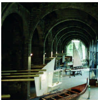
➔ Sala del Museu Marítim de Barcelona, organizador del Premio de Investigación "Josep Ricart i Giralt"

Los prestigiosos premios Bonaplata en el ámbito del patrimonio industrial catalán celebran en 2006 su décimo quinta edición. Convocados por la Associació del Museu de la Ciència i de la Tècnica i d'Arqueologia Industrial de Catalunya ( www.amctaic.org ) reconocen la labor investigadora, de difusión, restauración o nueva realización vinculada a la arqueología industrial, historia industrial o antropología histórica, entre otros aspectos. Sin valor monetario, el galardón consiste en una placa conmemorativa de plata que se otorga a las obras. Los aspirantes a los premios Bonaplata en cualquiera de los cinco grandes bloques previstos se centrarán en actuaciones llevadas a cabo entre el 1 de julio de 2004 y el 18 de junio de 2006. Las propuestas habrán de presentarse en la primera quincena de septiembre de este año.