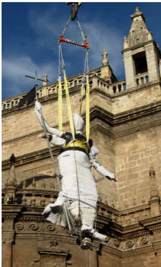
Q Izado del Giraldillo hasta su ubicación original (22 de julio de 2005)

La investigación y restauración realizada por el equipo técnico del Centro de Intervención en el Patrimonio Histórico del IAPH se ha realizado aplicando criterios mixtos: para la escultura (para su conservación con la mínima intervención y con materiales compatibles), y para el sistema mecánico, a partir de una reparación que hiciese posible el mantenimiento de su función, es decir, permitir el movimiento de la veleta, sostenerla y mantenerla unida a la torre. Para ello se ha empleado la tecnología más avanzada posible y los materiales más resistentes y de mejores prestaciones. De esta forma se ha recuperado el significado histórico y conceptual del Giraldillo.