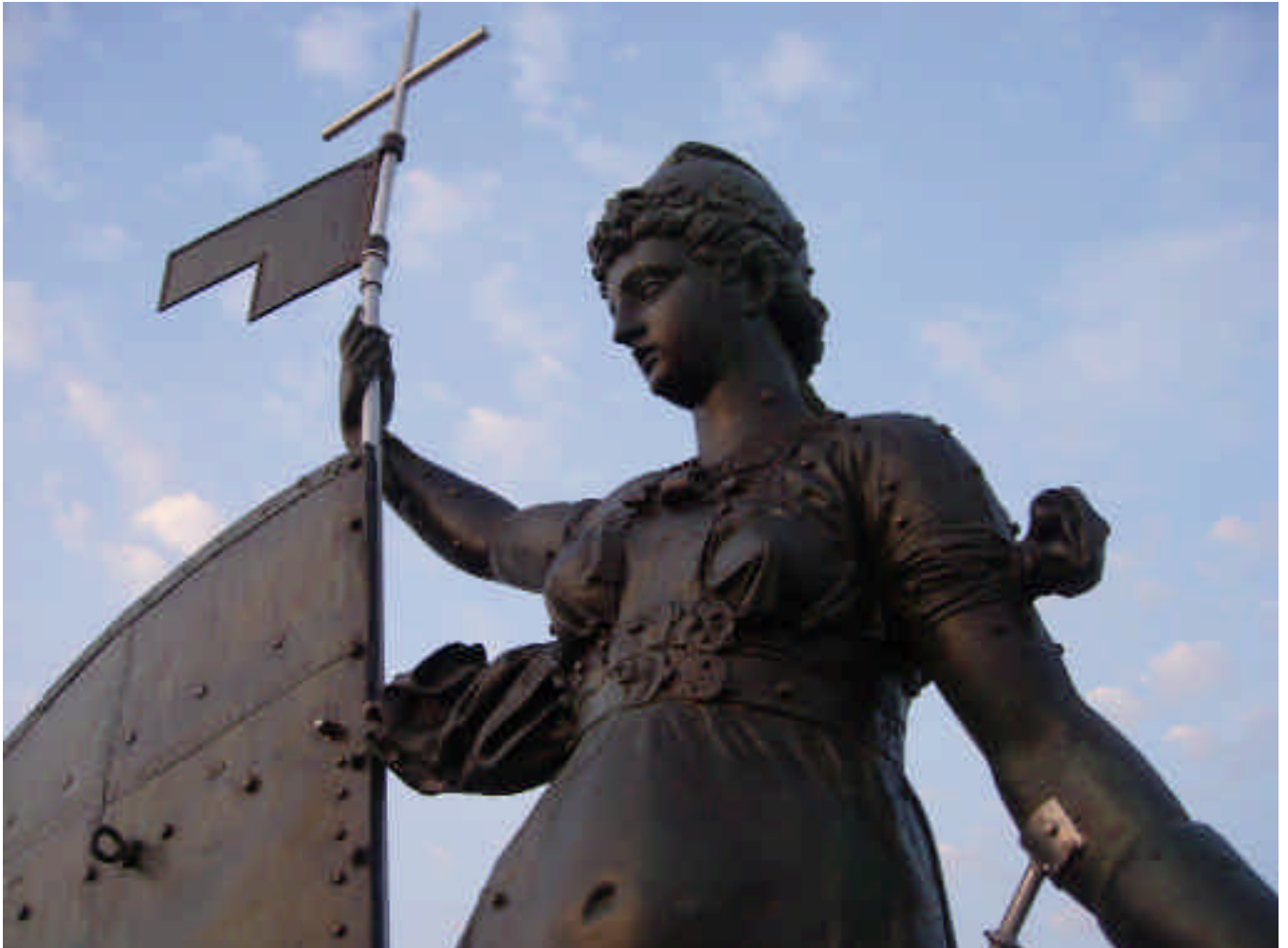
X El Giraldillo. Estado final tras la intervención (detalle) / EUGENIO FERNÁNDEZ RUIZ, IAPH U La ciudad de Sevilla a los ojos del Giraldillo / EUGENIO FERNÁNDEZ RUIZ, IAPH V Mapa de espesores medidos en la parte anterior del Giraldillo