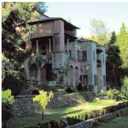
Monasterio de Yuste (Cáceres)

Diecisiete de los municipios por los que pasó el Emperador Carlos V en su recorrido desde Laredo hasta el Monasterio de Yuste, pertenecientes al País Vasco, Cantabria, Castilla y León y Extremadura, además de la Comunidad Jerónima de Yuste y la Fundación Academia Europea de Yuste constituyeron, el pasado 25 de abril, la Asociación de ciudades y municipios de la ruta de Carlos V.