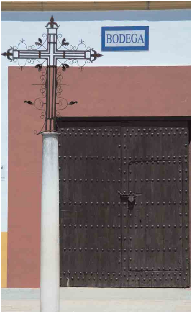
➊ Exterior Bodegas Aragón y Cía.