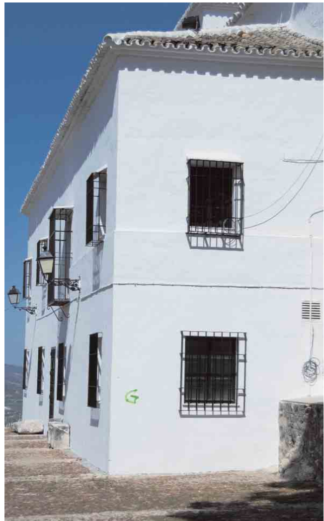
➋ Detalle dependencias auxiliares Santuario de Nuestra Señora de Araceli / ANICETO DELGADO MÉNDEZ, IAPH

resuelve en las agrocidades de un modo tan plástico, pudiendo emplear sus entramados urbanos y sus amplios términos como textos históricos y etnográficos útiles para entender el concepto de ciudad media interior . A través de la rica economía lucentina (actividades industriales, artesanales), de lo poco que queda de su arquitectura civil, edificios religiosos, arquitectura defensiva, deteriorado entramado urbano, o en su escasa arquitectura vernácula aún en pie y su desconocida arquitectura diseminada, podemos ver parte de la Historia de esta pequeña gran ciudad media y de su centralidad histórica. Pero podríamos haber visto aún más si en su último devenir contemporáneo se hubieran tenido en cuenta propuestas de