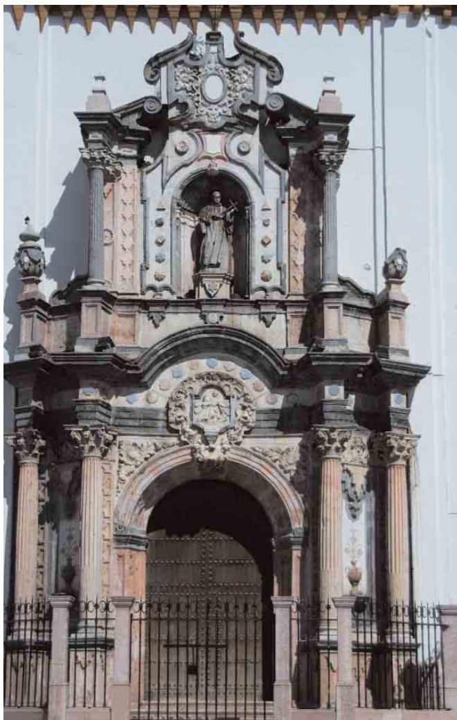
📍 Fachada de la Iglesia de San Juan Bautista