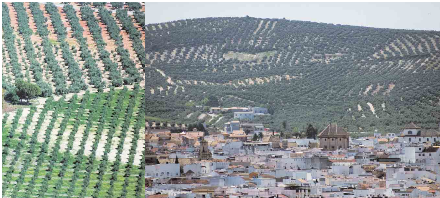
⦿ Panorámica de la ciudad de Lucena (Córdoba)

de Andalucía el aprovechamiento de las potencialidades que ofrecen estas ciudades medias por su interés patrimonial como ciudad en sí, ya que muchas de ellas no sufrieron las grandes transformaciones que trajo consigo el desarrollismo de mediados del XX; por el modelo urbano que aportan, en tanto han sabido mantener su morfología y tipología urbana tradicional; y por su importancia como patrimonio territorial, dada su capacidad para articular el territorio en tanto cabeceras comarcales.