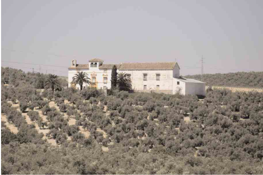
📍 Cortijo Capilla de los Corteses, Lucena (Córdoba) / ANICETO DELGADO MÉNDEZ, IAPH