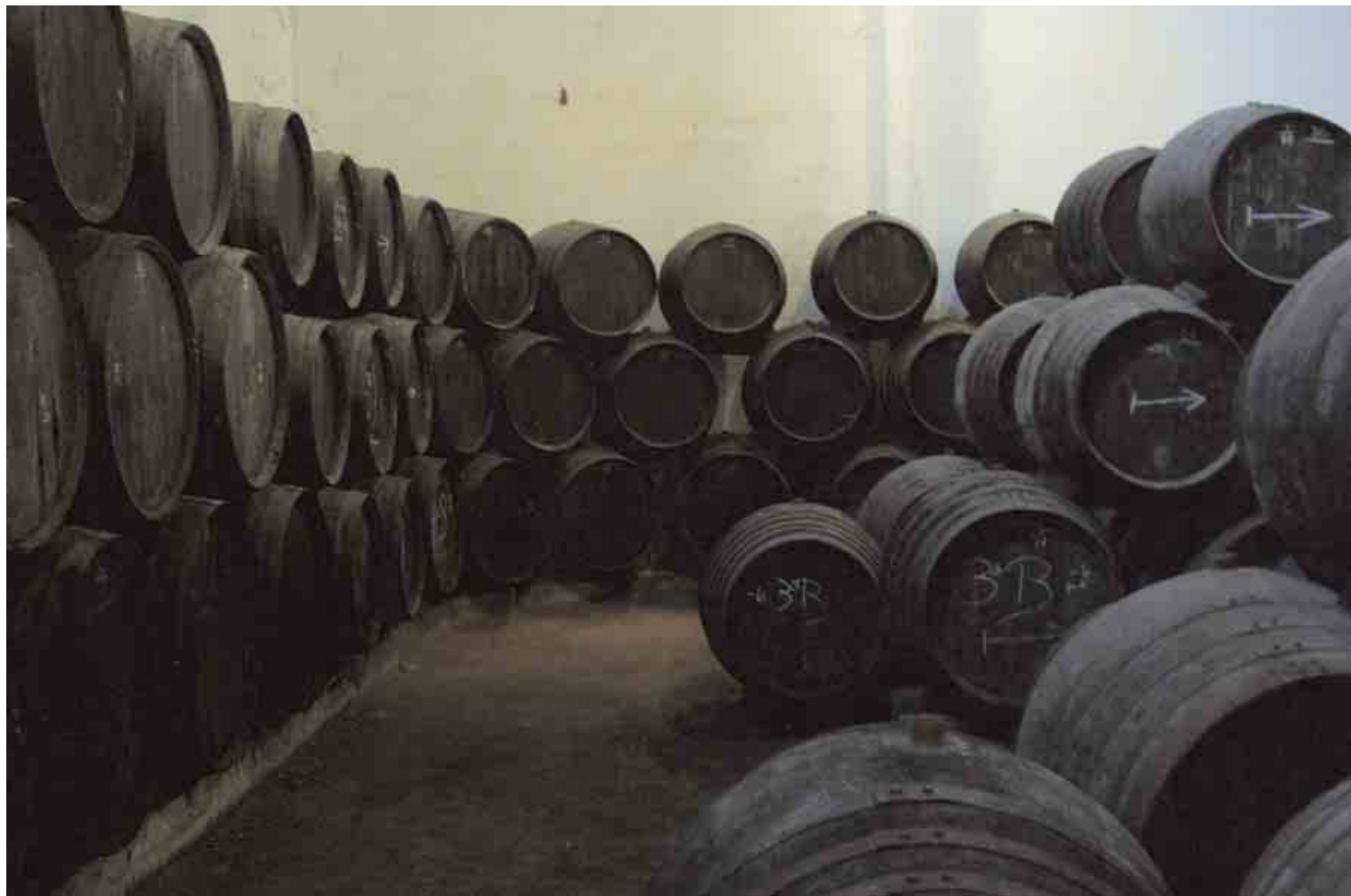
Interior Bodegas Aragón y Cía. / ANICETO DELGADO MÉNDEZ, IAPH

purista. La segunda, ejemplar singular del barroco lucentino, fue erigida por la Orden Hospitalaria de San Juan Bautista en 1755, destacando en su factura la portada de la iglesia, a modo de retablo, realizada en mármoles policromos y enriquecida con labores de embutidos, y la sobria fachada del centro hospitalario. Ambas conforman uno de los frentes de la Plaza de la Calzada o de San Juan de Dios, personalizando su ámbito urbano.