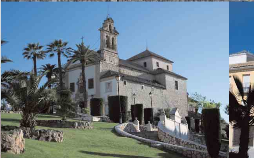
📍 Iglesia de Nuestra Señora del Carmen

medieval, jalonan el casco histórico lucentino un sin fin de ermitas, entre cuyos tipos más representativos sobresalen la Ermita de Dios Padre y la de La Aurora. Esta última, de gran devoción popular, cobra especial relevancia en octubre, cuando todo el barrio se llena de castañas asadas y en las madrugadas cantan los campanilleros por las calles.