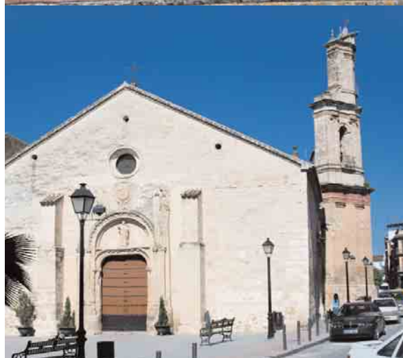
📍 Iglesia de Santiago

ANÁLISIS urbanístico de centros históricos de Andalucía : ciudades medias y pequeñas. Sevilla : Consejería de Obras Públicas y Transportes, 2001 *