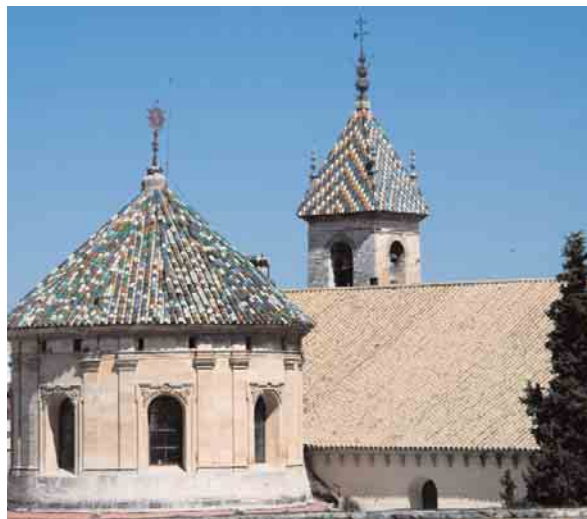
📍 Iglesia de San Mateo y Sagrario / ANICETO DELGADO MÉNDEZ, IAPH