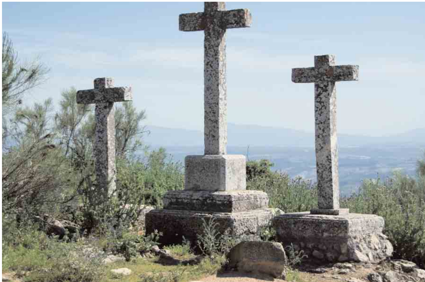
● Santuario de Nuestra Señora de Araceli. Detalle Calvario / ANICETO DELGADO MÉNDEZ, IAPH

cuya intencionalidad compositiva supera lo puramente funcional constituyendo uno de los capítulos más significativos y menos conocidos del patrimonio cultural de su término.