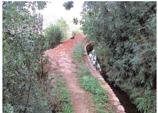
➤ Tramo final de la Acequia Real-Acequia del Tercio. Construida por la dinastía nazarita, ha surtido de agua a la Alhambra desde su construcción / PEDRO SALMERÓN ESCOBAR

mo es motor de desarrollo económico y genera activos que vuelven hacia el propio monumento. El presupuesto íntegro que se obtiene por la visita turística, incrementado con las aportaciones de la Junta de Andalucía y del Estado, revierte en la Alhambra permitiendo su conservación y fomentando la actividad investigadora y de conocimiento.