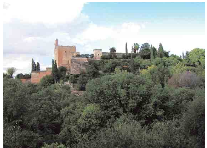
➤ La Alcazaba desde el Carmen de los Catalanes, situado a extramuros de la Alhambra al suroeste del monumento

del Patronato? ¿Cómo van a implicar a los ciudadanos de Granada en la puesta en marcha del plan para que asuman las decisiones que les afecten en su vida cotidiana?