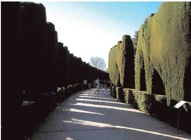
➤ Calle Real Alta, calle principal de la Medina de la Alhambra