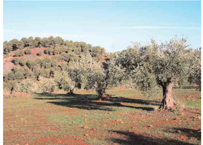
➤ Dehesa del Generalife / PEDRO SALMERÓN ESCOBAR