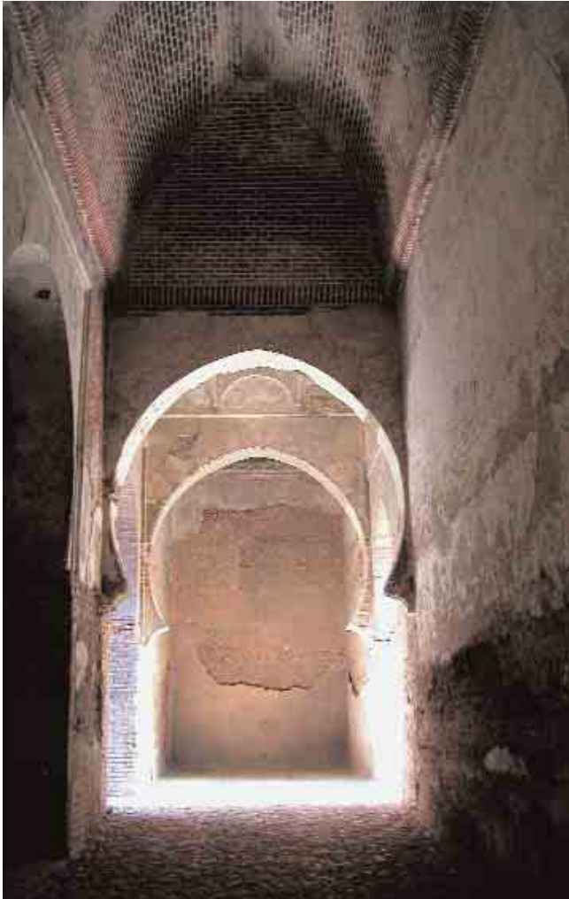
➤ Puerta de las Armas en La Alhambra / PEDRO SALMERÓN ESCOBAR