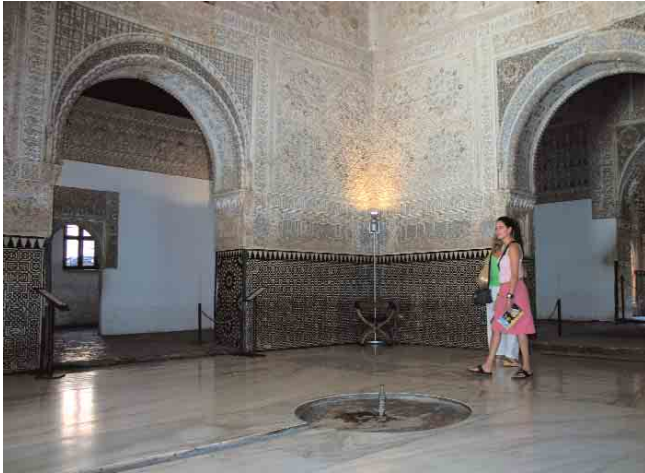
➤ Visita sosegada en la Sala de Dos Hermanas / PEDRO SALMERÓN ESCOBAR