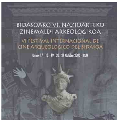
➔ Cartel anunciador del festival de la edición pasada

El próximo mes de octubre se celebrará el VII Festival Internacional de Cine Arqueológico del Bidasoa. Organizado por el Ayuntamiento de la localidad guipuzcoana de Irún, este evento se consolida como espacio de promoción y divulgación del trabajo arqueológico entre el público general a través del lenguaje audiovisual.