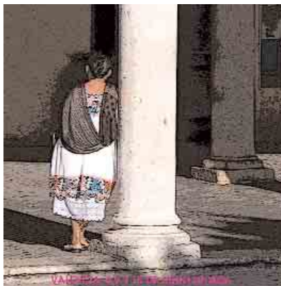
➔ Detalle del cartel de la II edición del congreso

La gestión del patrimonio cultural y el desarrollo local es el tema central propuesto para el III Congreso Internacional de Patrimonio Cultural y Cooperación al Desarrollo, que tendrá lugar en México del 6 al 8 de marzo de 2008.