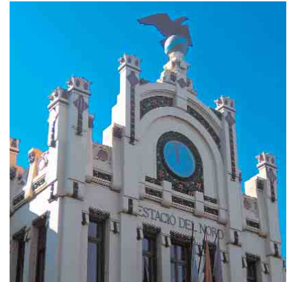
➤ Fachada de la Estación del Norte de Valencia, obra del arquitecto Demetrio Ribes

Por tercer año consecutivo la Sociedad Española de Historia Agraria (SEHA) convoca el Premio de Historia Agraria, cuyas bases están disponibles en www.historiaagraria.net/32.asp?op=2 . El trabajo premiado, que se habrá enviado antes del 15 de septiembre a la secretaria del SEHA, además de recibir una compensación económica de 600€, será publicado en la revista Historia Agraria .