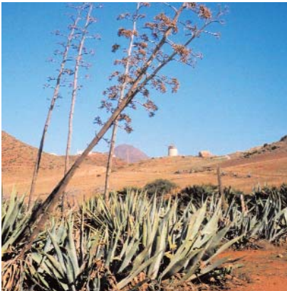
📍 Cabo de Gata (Almería), uno de los espacios españoles declarados Reserva de la Biosfera

Madrid será la sede en febrero de 2008 de un congreso internacional en el que se darán cita profesionales, investigadores y gestores directamente implicados en las Reservas de Biosfera, con el objetivo de analizar avances y barreras desde 1995 (año del II Congreso, en Sevilla) y configurar criterios y orientaciones que se incluyan en el Plan de Acción 2008-2012.