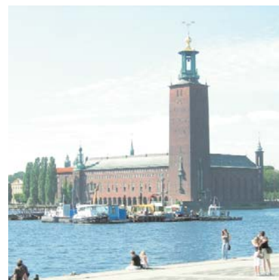
➊ Ayuntamiento de Estocolmo (Suecia)

Las solicitudes para el premio, que habrán de cursarse obligatoriamente a través de la página www.stockholmchallenge.se , se admitirán hasta el 31 de diciembre de 2007 y la ceremonia de entrega tendrá lugar durante la denominada "Semana del desafío", del 18 al 22 de mayo de 2008. El programa incluye una serie de talleres, una conferencia, reuniones sociales, visitas de estudios y la ceremonia de entrega de premios en el Ayuntamiento de Estocolmo.