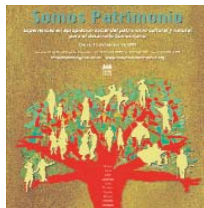
➋ Cartel anunciador de la convocatoria de los premios del CAB

El CAB ( www.cab.int.co ) pretende valorar y difundir el patrimonio cultural y natural de los países miembros mediante diferentes mecanismos: difusión de experiencias comunitarias de apropiación social del patrimonio, reconocimiento de espacios de expresión de las regiones y provincias de los países, construcción de lazos para el intercambio de experiencias regionales. Por otra parte, trabaja en la recuperación de la memoria colectiva y las herencias ancestrales y en el reconocimiento de la interculturalidad como un valor que favorece la inclusión del otro.