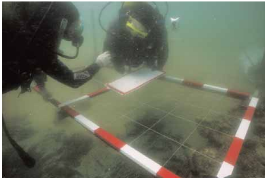
➊ Técnicos del Centro de Arqueología Subacuática (CAS) trabajando en el pecio de Fougueux (San Fernando, Cádiz)

4. Suficiencia de medios. Para el desarrollo de este Plan sería conveniente solicitar a los departamentos correspondientes que facilitasen la dotación presupuestaria necesaria a los Centros de Arqueología Subacuática para que